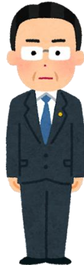
中小企業診断士・コンサルタント